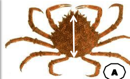
araignée de mer (A)

IMPORTANT : les casiers à parloir ne sont pas autorisés en Bretagne